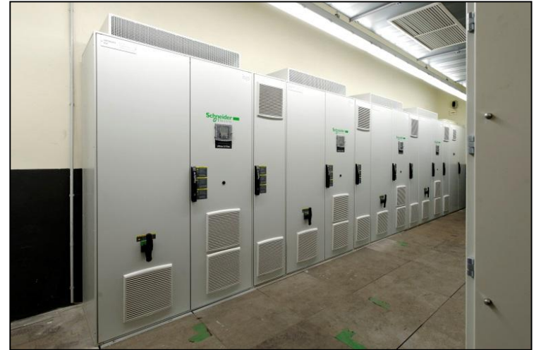
• Frequenzumrichter Schaltschränke für Reinwasserpumpen