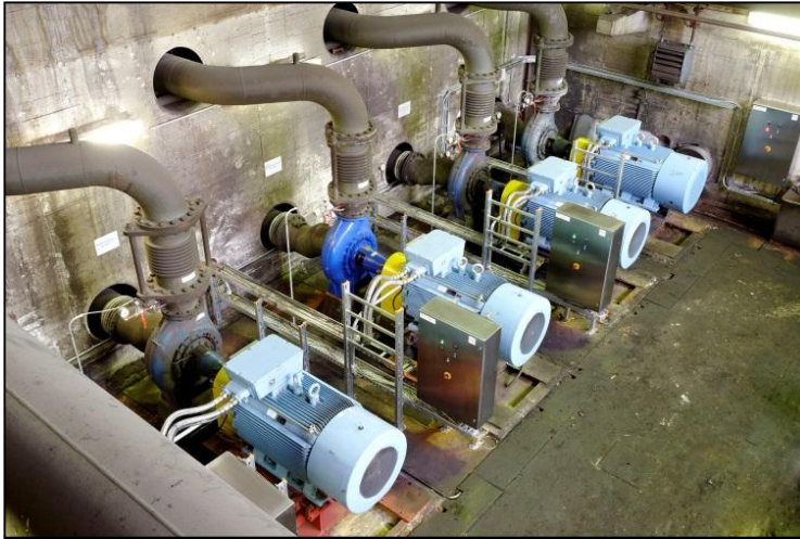
• Bedienstellen für Reinwasserpumpen