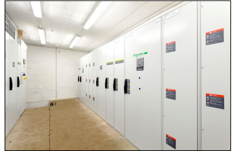
• Energieeinspeisung für Presswasserpumpen