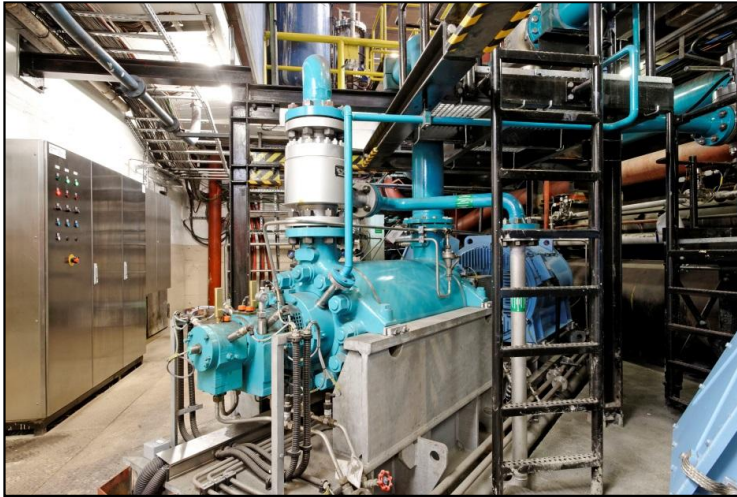
• Steuerschaltschrank für Presswasserpumpen